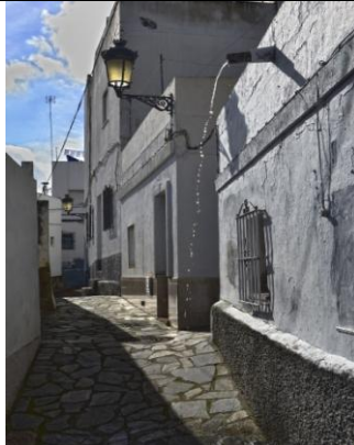
Foto. Calle De la Congregación